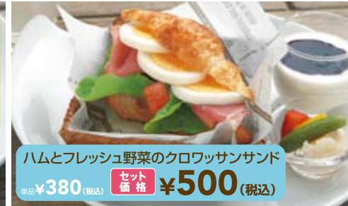
ハムとフレッシュ野菜のクロワッサンサンド 単品 ¥380 (税込) セット価格 ¥500 (税込)