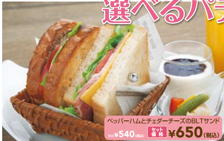
ペッパーハムとチェダーチーズのBLTサンド 単品 ¥540 (税込) セット価格 ¥650 (税込)