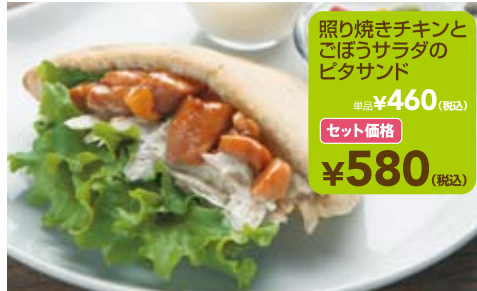
照り焼きチキンと ごぼうサラダの ピタサンド 単品 ¥460 (税込) セット価格 ¥580 (税込)

セットがお得!! 9:00~14:00限定 ドリンク + ヨーグルト + ピクルス お好きなドリンク(¥400~)が選べて ヨーグルト、ピクルスがついたお得なセットです。