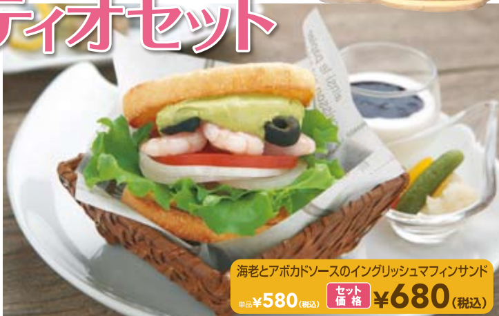
海老とアボカドソースのイングリッシュマフィンサンド 単品 ¥580 (税込) セット価格 ¥680 (税込)

セットがお得!! 9:00~14:00限定 ドリンク + ヨーグルト + ピクルス お好きなドリンク(¥400~)が選べて ヨーグルト、ピクルスがついたお得なセットです。